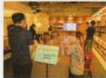
はこだて・エコフェスタ2024

はこだて・エコフェスタ2024in函館鷹屋書店 (7/27) 大森浜ビーチコーミング (7/30,8/6) ダンボールコンポスト講習会 (5/14,9/12) 生ごみコンポストから食の循環を考える講演会 (7/9) バッグ型コンポスト堆肥づくり支援事業 (8月)