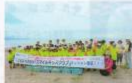
大森浜ビーチコーミング