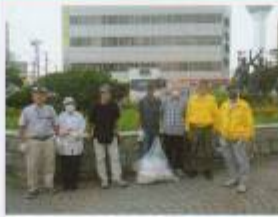
函館港まつり早朝清掃

春のクリーングリーン作戦 (4/21) 亀田川清掃 (5/11) 大森浜環境美化活動 (7/6) 函館港まつり早朝清掃 (8/2~4) 秋のクリーン作戦 (9/8)