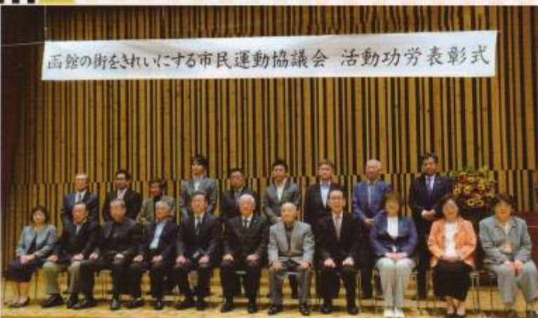
函館の街をきれいにする市民運動協議会 活動功労表彰式

また、当協議会の趣旨に賛同され、継続的に賛助いただいている事業者に対して感謝状を贈呈しました。