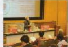
ダンボールコンポスト講習会