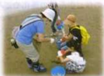
大森浜ビーチコーミング