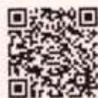
集団資源回収 ホームページ

また、拠点回収を行っている町会・自治会等の方に「資源回収集積場看板」を無料提供しておりますので、ぜひご活用ください!