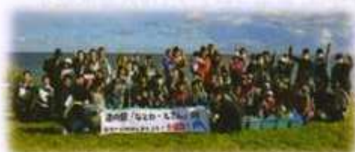
なとわ・えさん DE 海洋ごみ問題を考えよう