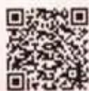
ダンボール コンポスト・メイト 募集ホームページ