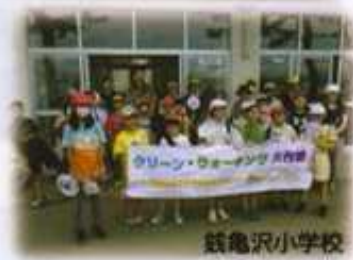
函館小学校 クリーン・ウォーキング大作戦