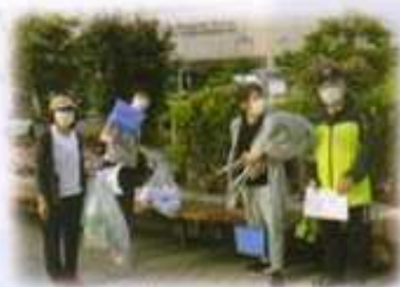
函館港まつり早朝清掃