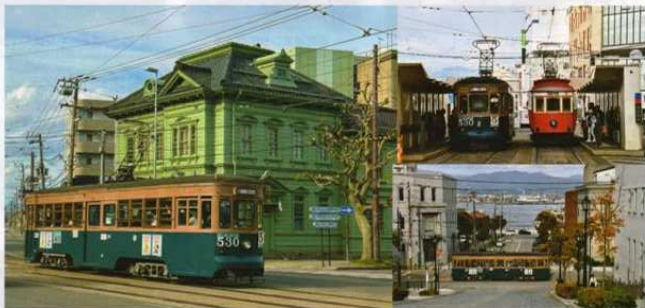
函館市電 530 号(ごみゼロ号)の運行(R5.10.15)