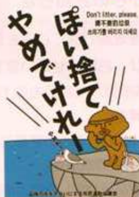
(450 mm × 600 mm アルミ複合板)